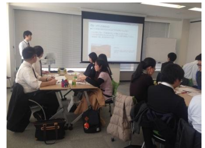
職業体験セミナーに参加する学生

システムエンジニアの職業体験セミナーや求人紹介セミナーなど、限られた時間での仕事研究、企業研究をサポートするための様々なイベントを開催。広報解禁から選考開始までの3月から6月にかけて、約50回のセミナーを開催予定です。IT・Web企業紹介セミナーやBtoB企業紹介セミナーなど、学生がこれまで知らなかった企業に出会えるセミナーの開催も予定しています。