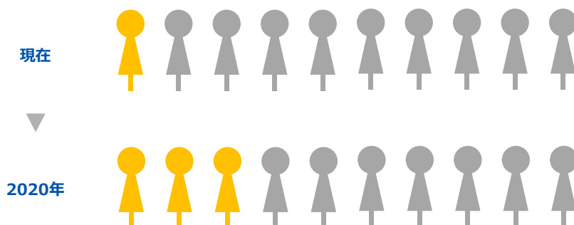
「新卒エージェント」サービス普及率（当社推計）

転職市場では広く受け入れられているエージェントサービスですが、新卒市場での利用者（サービス登録者）は現在、約 10%にとどまります。DODA新卒エージェントでは、学生へのサービス認知向上を行い、2020年には、新卒市場において約 30%の就活生が利用するサービスへの拡大を目指します。